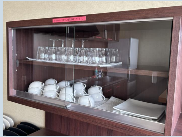
さら お皿やコップなど